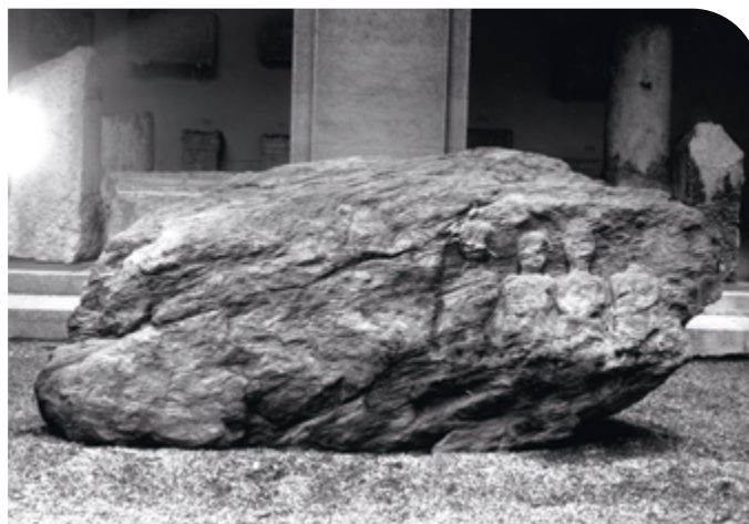
La pierre de 3m sur 1,50m pèse plus de trois tonnes.