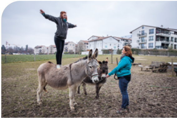
Figure de voltige.