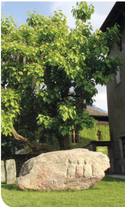
Copie du menhir installée en 1998 à la Grand Cour, Mairie de Troinex.

Fameux mégalithe dont la copie est installée dans le parc de la Mairie, la Pierre-aux-Dames fut dressée aux temps préhistoriques sur la commune de Troinex, non loin de Bossey. Pierre aux fées ou de déesses, elle a soulevé de passionnantes hypothèses.