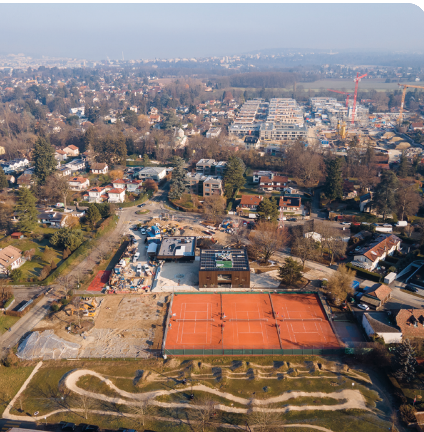
Prise de vue aérienne, par drone, du chantier de la crèche, du restaurant scolaire et de la zone sportive.

d'entreprises et autres véhicules stationnant à l'année dans les chemins communaux. Cette mesure nécessitera un effort de toutes et tous, mais elle permettra de libérer de nombreuses places pour les visiteurs et les autres stationnements de courtes durées. Toutes les informations, ainsi que le règlement d'attribution des macarons, vous seront transmises lorsque l'autorisation sera