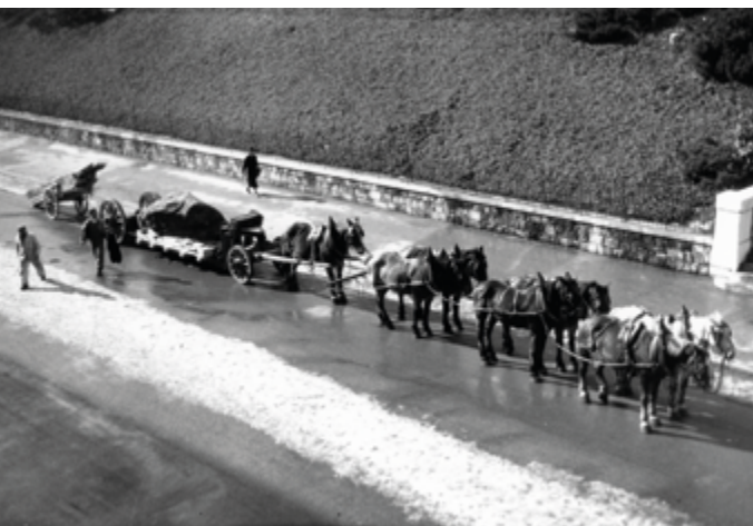
Transfert de la Pierre-aux-Dames dans la cour du Musée d'Art et d'Histoire, printemps 1942.