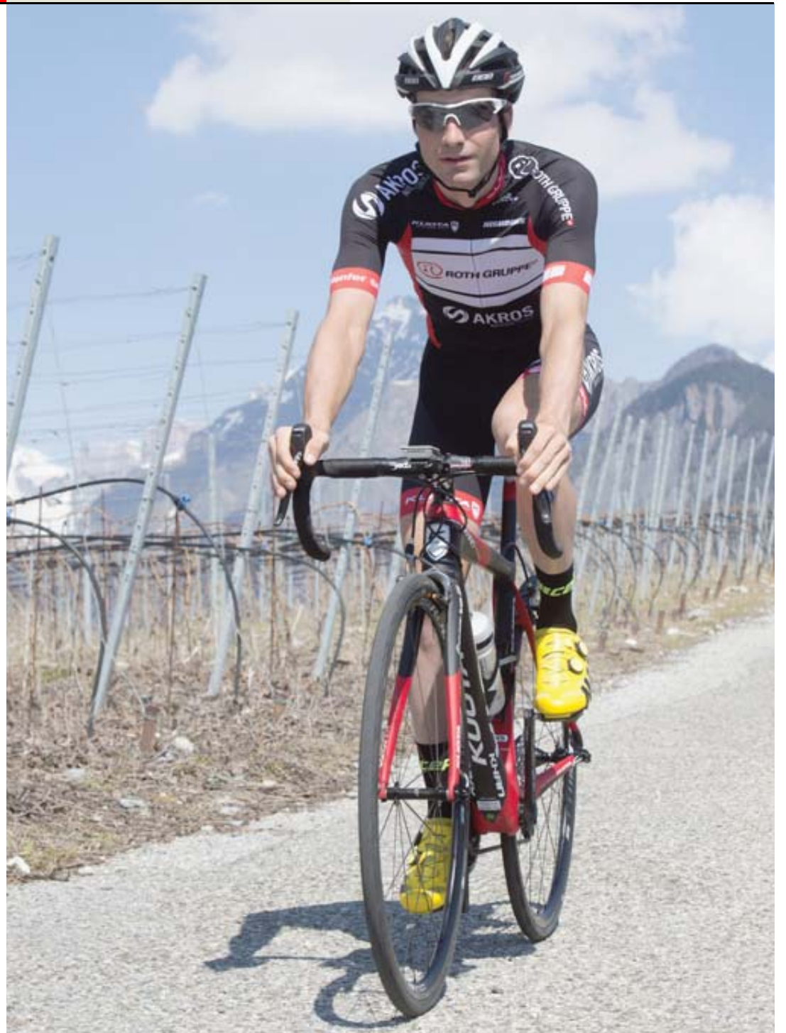
Le cycliste du Team Roth-Akros sera l'un des favoris dimanche.

le leader de la Française des jeux lors de la prochaine Vuelta, pourrait bien rouler auprès des populaires depuis Le Châble. Sa présence sera forcément une des attractions de la journée. RT